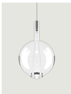
Sky-Fall Round large